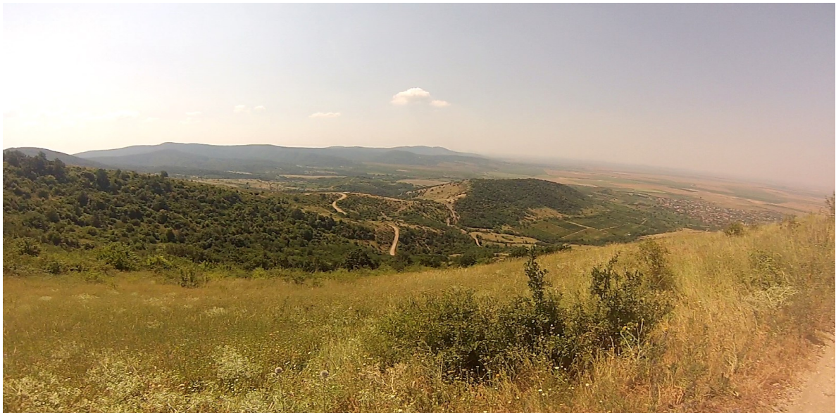
Panoramă asupra Câmpie de Vest și a laturii sudice a Munților Zărandului