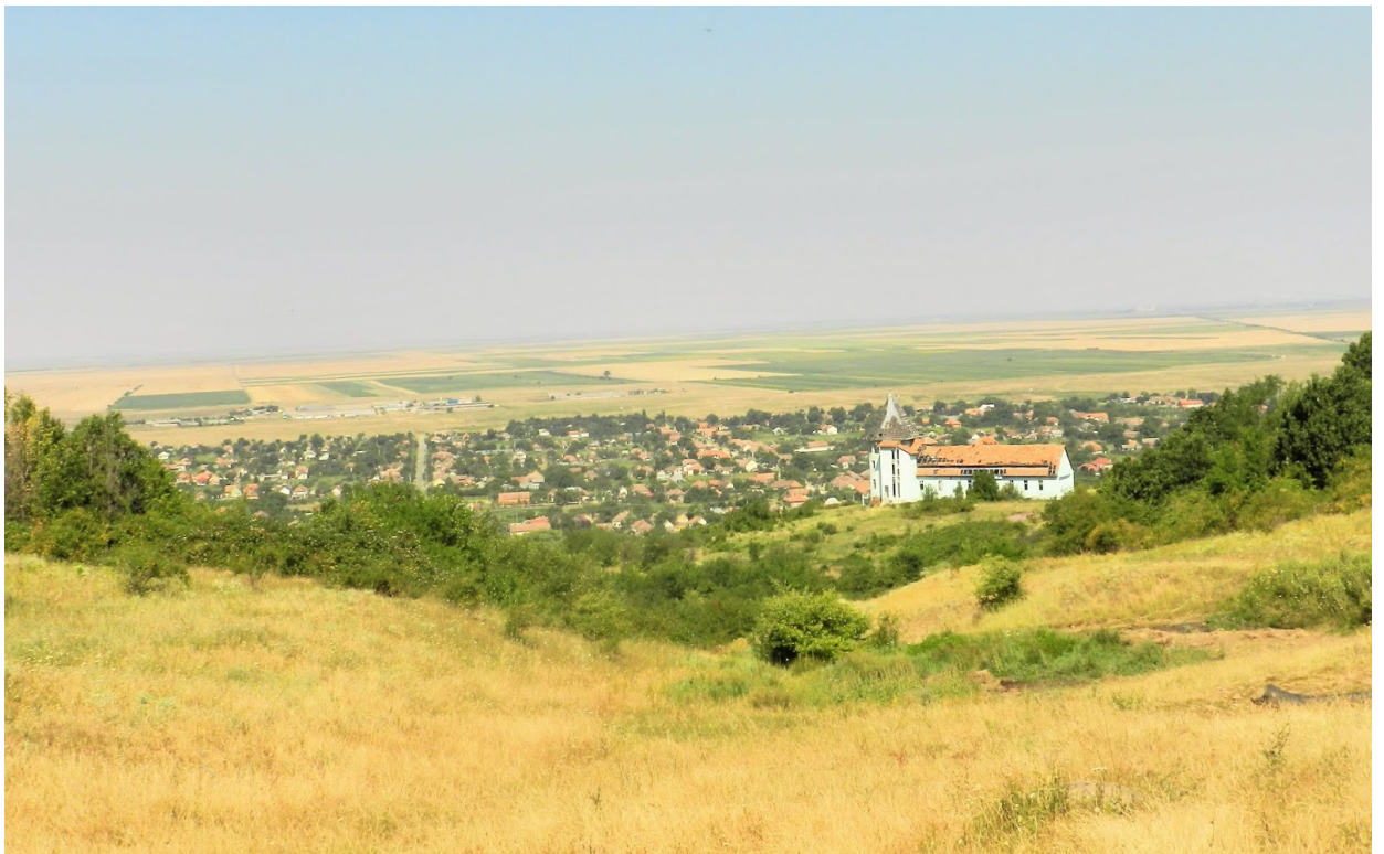
Și spre câmpia Aradului